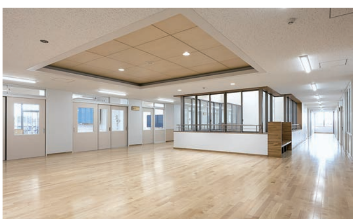
多目的室(習熟度別指導教室)前のオープンスペースと吹き抜け

東調布第三小学校の改築が、区民の皆様、近隣の皆さまを始め、多くの方々の多大なるご理解ご協力を賜り、Ⅰ期工事完成の運びとなりました。戦後の人口増加を受け、東調布第三小学校は東調布第一小学校から分離する形で昭和25年に開校いたしました。これまでの校舎は、昭和10月に建設され、過半数の増設や耐震補強工事などを経、現在まで児童数の変化や社会的変化に対応してまいりました。しかしながら、校舎の大半が築50年を超え、老朽化が進行していることに加え、耐震性の向上やメンテナンスの観点から、令和4年6月に改築工事に着手し、令和6年3月に校舎棟の一部竣工となりました。 本校の改築に際しては、グループ学習や発表形式の学習など、主体的な学びの場を創出した多様な学習環境を開けることに加え、児童の学びの場としての魅力を向上させるべく、校舎の内部空間に多目的室や図書支援施設などを併設し、今年10月からの運用を開始する予定です。 また、Ⅱ期工事は、高層者支援施設の整備や、地域集会所の併設を予定しています。最後は本整備に尽力いただきました区民の皆様、近隣の皆さまを始め、関係各位に心から感謝を申し上げます。また、7月に竣工した校舎で、子どもたちが笑顔でいきいきと学び、健やかな成長を遂げることを心から願っています。