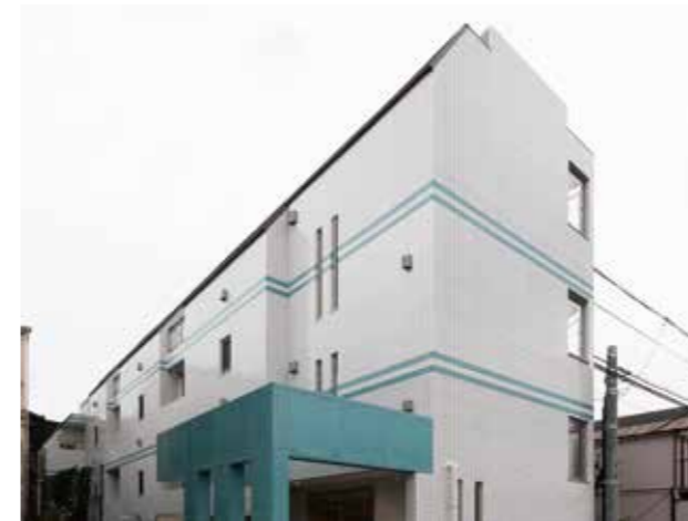
エメラルドブルーが原