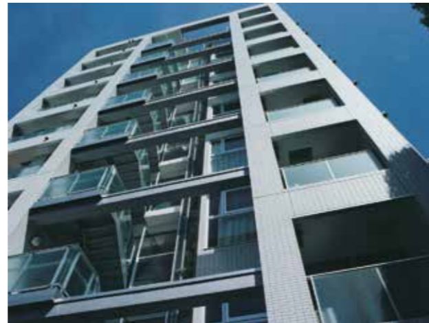
SK Flats 東神奈川