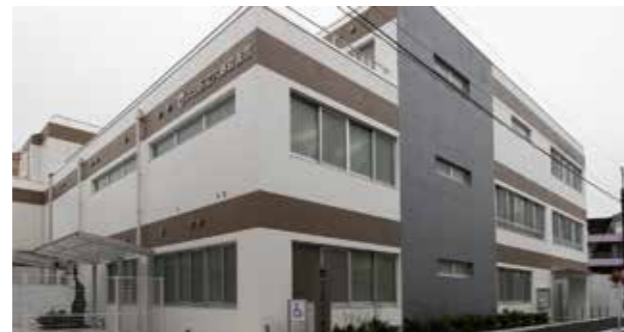
大田区立六郷図書館