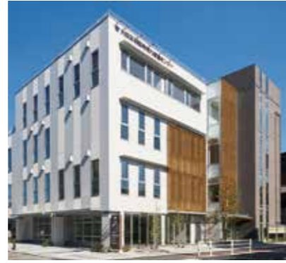
大田区羽田地域力 推進センター