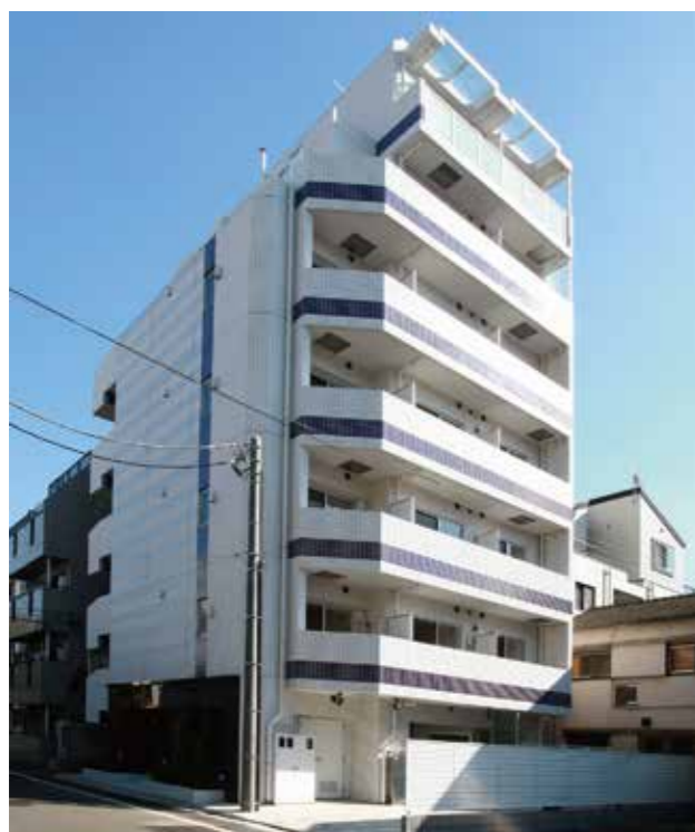
ヴァレッシア蒲田