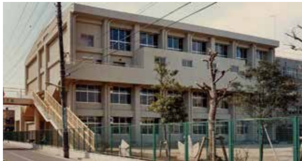
大田区立高畑小学校体育館