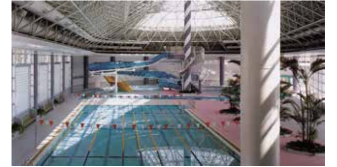
萩中公園プール(屋内)