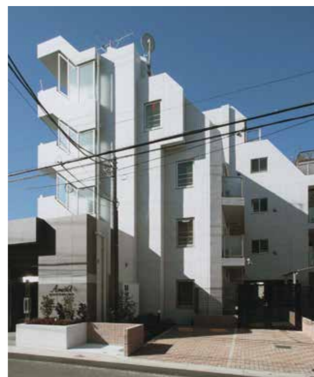
アマヴェル羽田空港