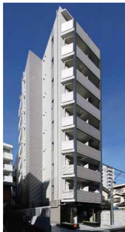
ヴァレッシア川口