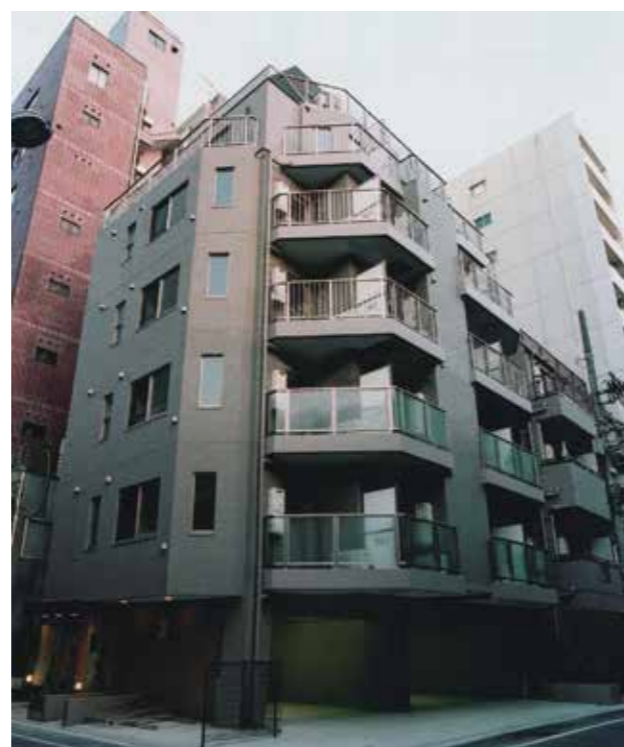
リクエスト秋葉原