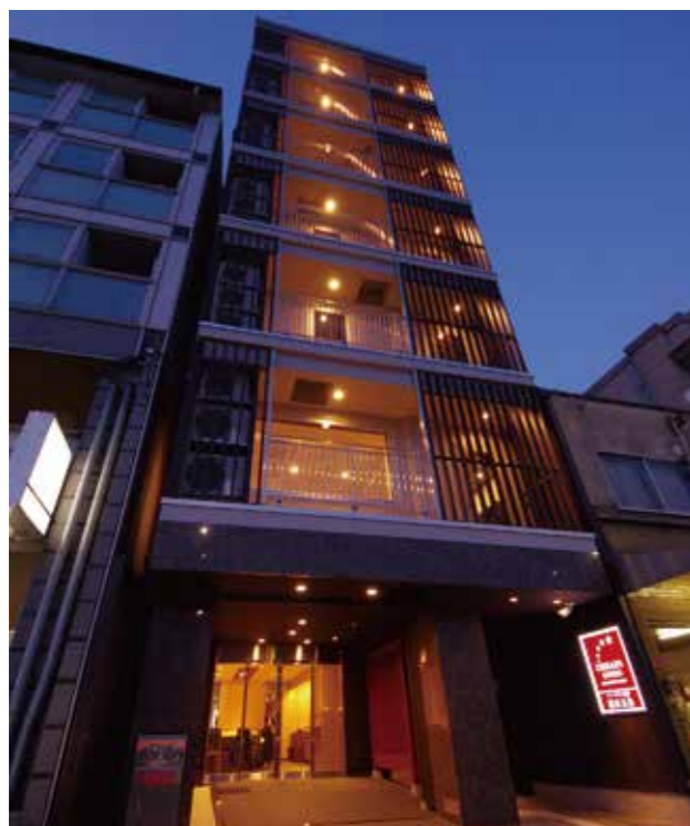
アーバイン京都清水五条