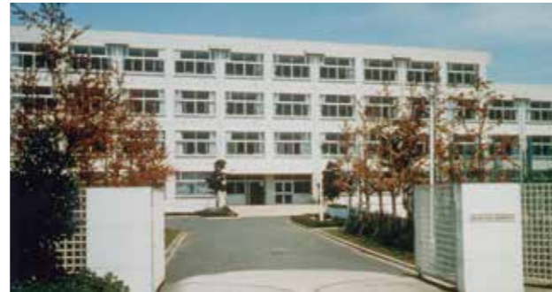
東京都立羽田工業高等学校