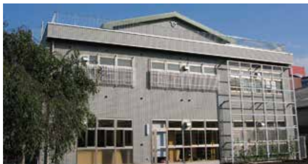
大田区立浜竹図書館