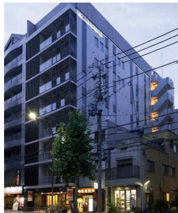
アーバイン四条大宮