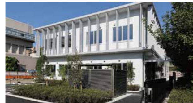
多摩川清掃事務所