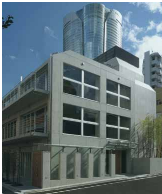
西麻布キューブエグゼクティブ

用地を取得開発し、潤滑に収益を生む企画立案から設計・施工、販売・管理まで事業物件の全てをトータルしてサポートいたします。ワンルームタイプ・ファミリータイプなど、時代と地域のニーズを鑑みた最適なお提案で、お客様の事業計画をお手伝いいたします。