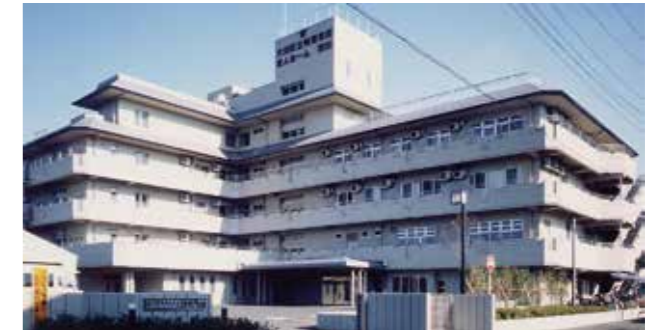
大田区立特別養護老人ホーム 羽田