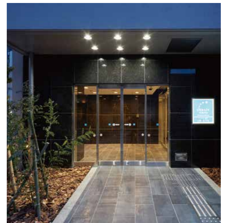
アーバイン東京 上野・北千住