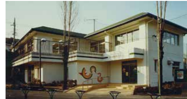
大田区立洗足池児童館