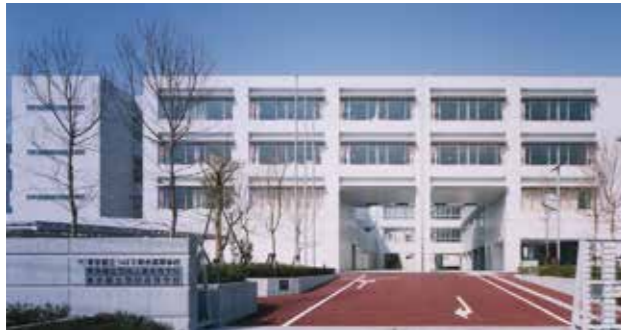
東京都立つばさ総合高等学校