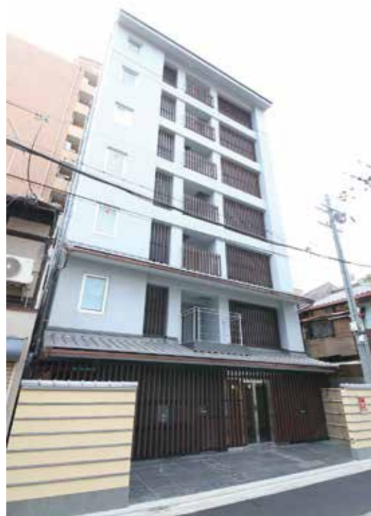
アーバイン京都河原町通

全国に50施設を超える実績を誇ります。ここで培われたノウハウを惜しむことなく発揮し、立地調査、事業計画、建設、運営まで全てをトータルでサポートいたします。刻々と変わるトレンドやニーズ、エンドユーザーの動向などコンサルティングもお任せください。