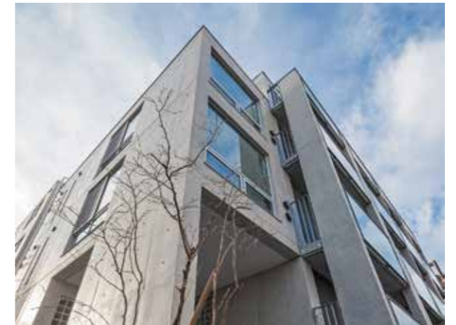
コートモデリア赤坂 895