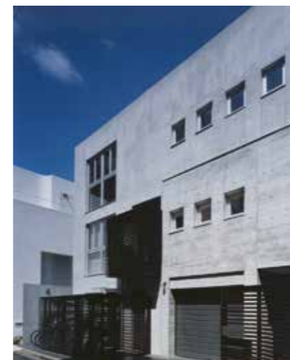
小林邸 賃貸併用住宅