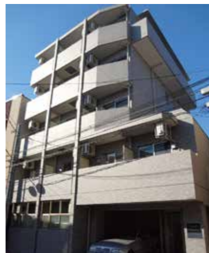
サンスターレ新蒲田