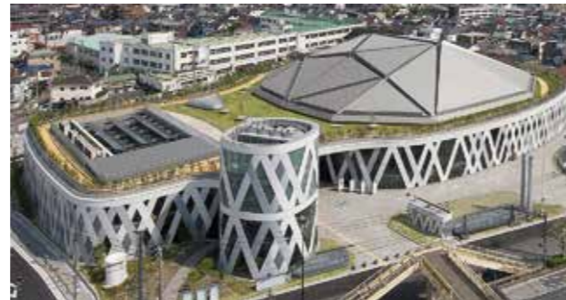
大田区総合体育館