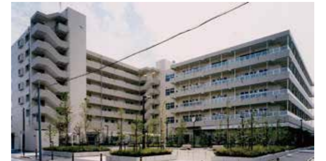
本羽田二丁目第2工場アパート